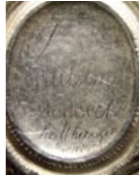
Ingekraste opschriften op de achterzijde van de dubbele cartouche.