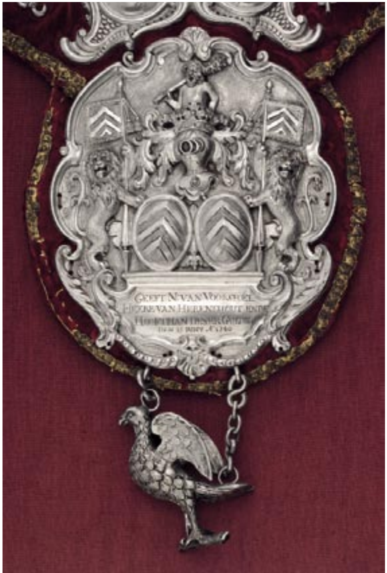
› Gildenbreuk van Reynegom. Detail van de van Voorspoelplaat.