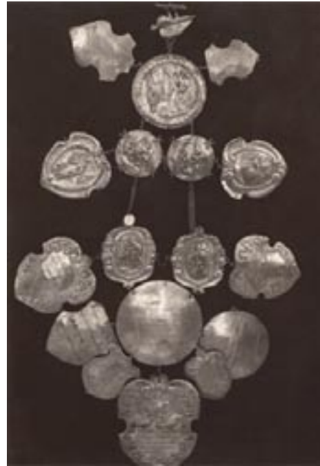
Breuk van de Kolveniersgilde van Sint-Antonius in Herenthout, 17de en 18de eeuw (?), Privé bezit (?).