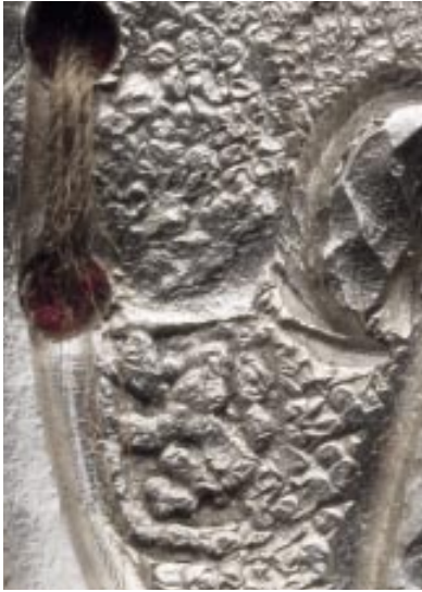
Stadsmerken voor Brussel.