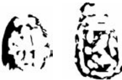
Het Sint-Michielshoofdje voor Brussel en de klimmende leeuw in schild.