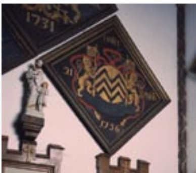
‹ Rouwbord van Livine-Norbertine van Voorspoel, overleden op 21 september 1756. Herenthout, kapel van het kasteel Herlaar.

Aan de brede kraag of ketting hangt, tegenover de grote borstplaat, een tweede gedreven plaat die precies past tussen de twee met elkaar verbonden cartouches. Deze plaat beeldt in zeer verzorgd drijfwerk een tweede alliantiewapen af. Het gegraveerde opschrift onderaan vermeldt dat deze breuk door Norbert van Voorspoel, heer van Herenthout aan de gilde werd aangeboden op 15 juni 1740 toen hij hoofdman was: “Geeft N: van Voorspoel / Heere van Herenthout ende / Hooftman deser Gulde / den 15 Juny An° 1740”. Op de plaat werden de zilvermerken aangebracht die we verderop zullen