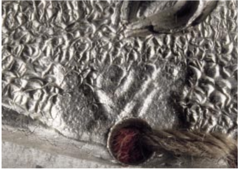
Meesterteken van Petrus Van Eesbeek.